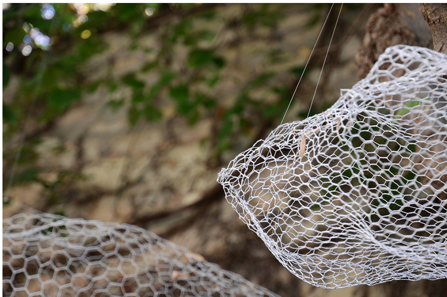
La tête dans les nuages - Collectifs zdées