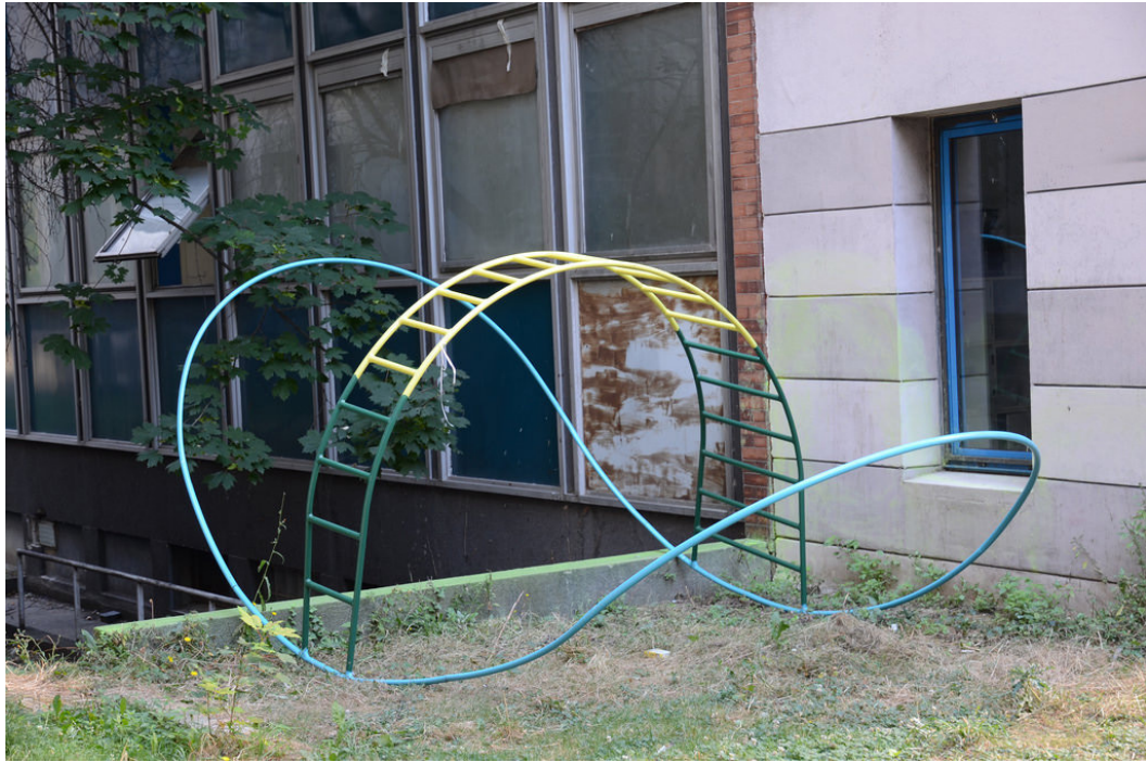
Sortir de sa maison - Antoine Vallée