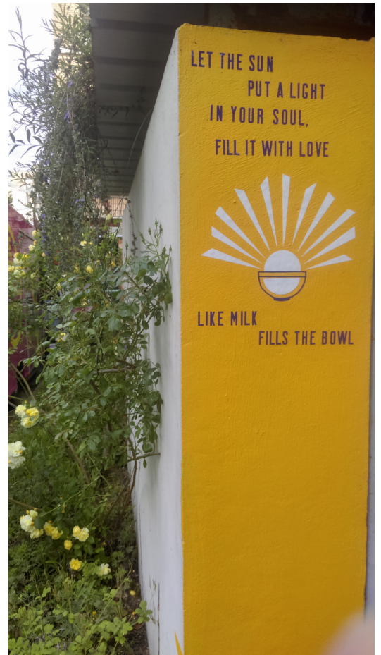
Poetic Mapping - Etudiants à l'ISCOM