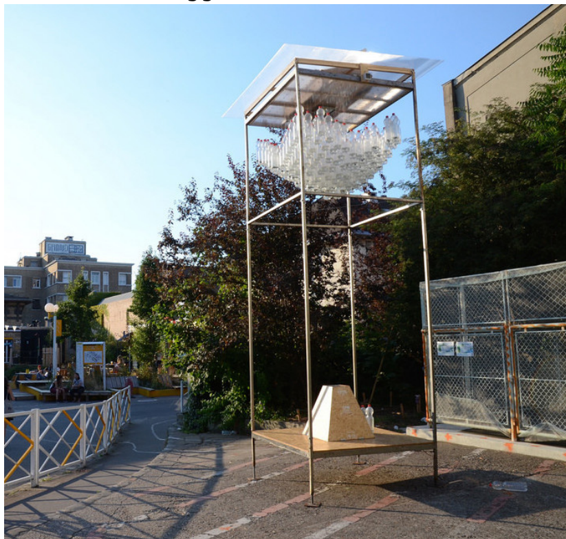
La sentinelle - Hapax Architecture