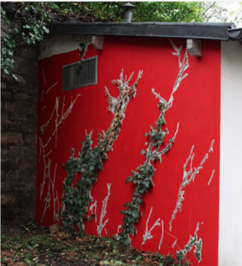
Il faut vraiment rajouter de la lenteur au monde - Cristophe Cuzin