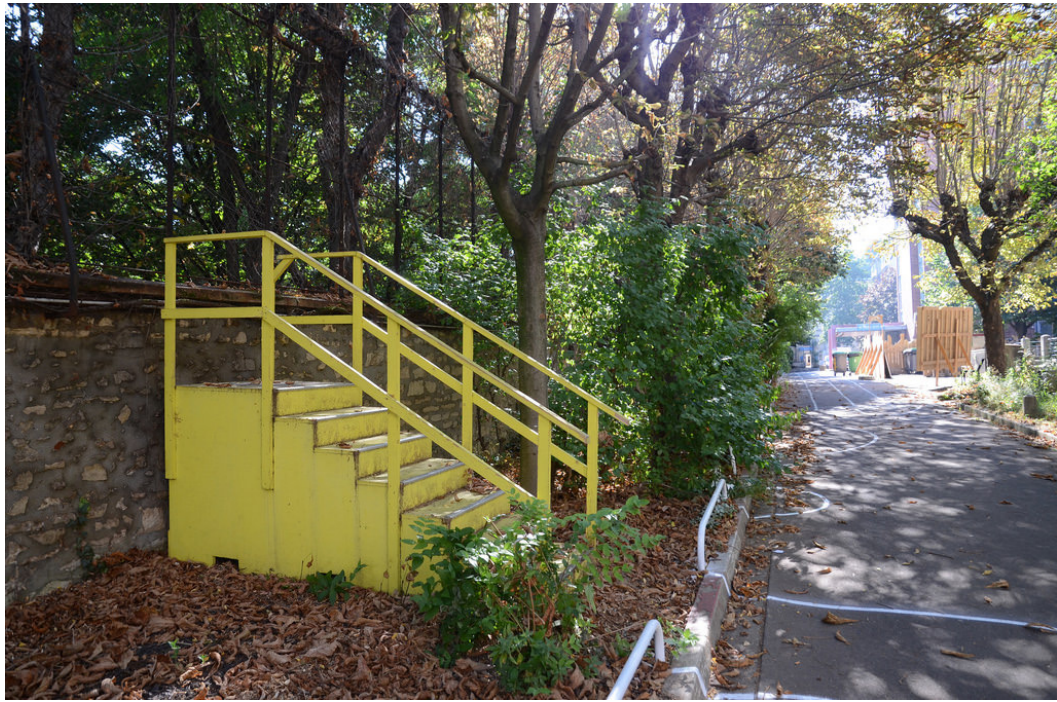
Escalier Jaune - Yes we camp