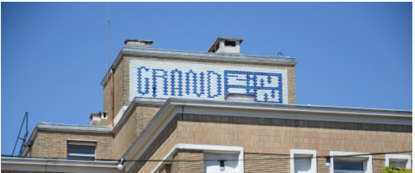
Grands Zinzins - Yes We Camp