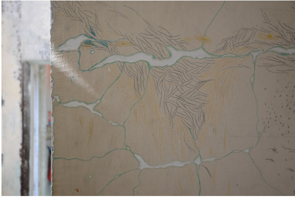
La peau des murs - Alice Millien