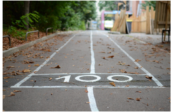
Peinture au sol / Parcours Sportif - Yes We Camp