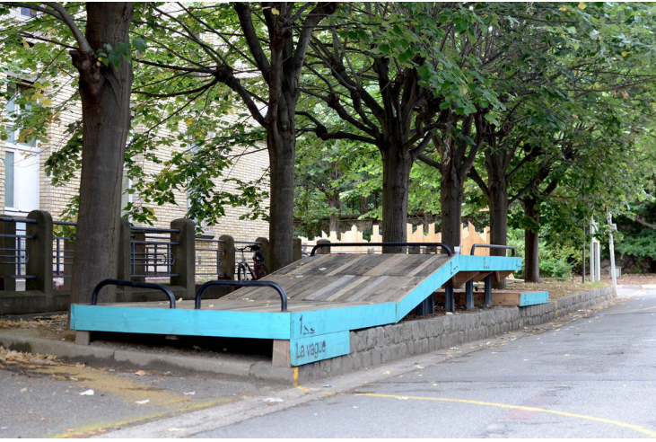
La Vague - Etudiants en Master 1 de l'école supérieur d'architecture de Paris